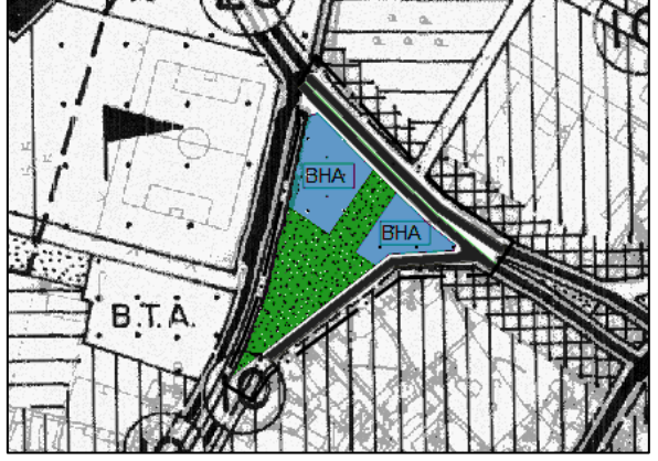
Plan deęiřiklięi rneęi