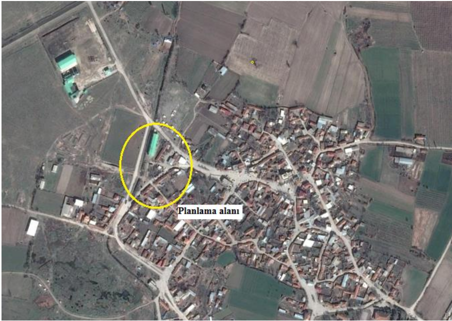
Planlama alanı (Google earth'den alınmıştır)

Parselin yer aldığı bölge Çeltikçi Mahallesi yerleşik alanının batısında ve mahalle merkezine 300 m mesafededir. Alanın batısından sulama kanalı geçmekte olup kanalın her iki kenarında 10 m yol planlanmış durumdadır. Parselin kuzeyinden 20 en kesitli olarak planlanmış olan ana ulaşım aksı geçmektedir. Parselin doğusunda meskun konut alanları yer almaktadır.